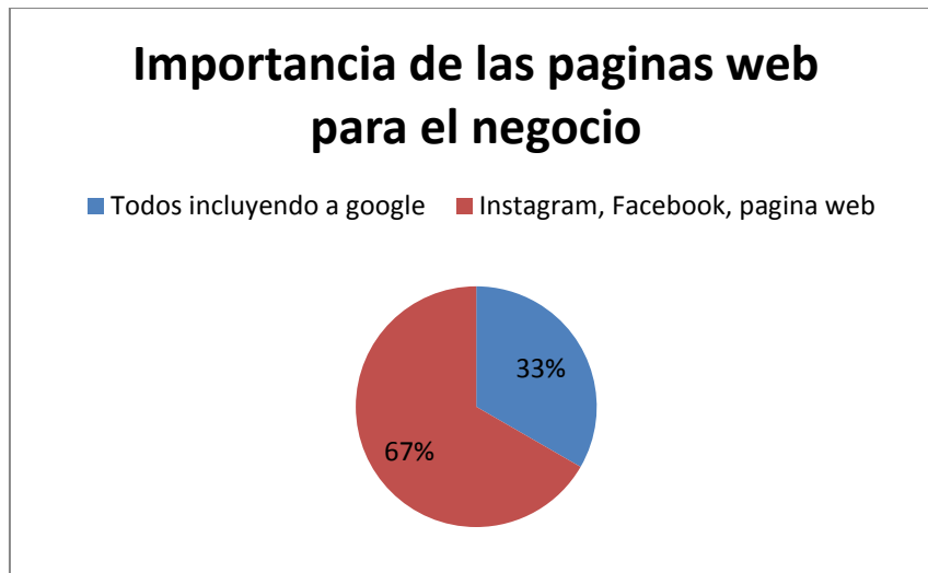
Tabla 2 Importancia de las páginas web para el negocio